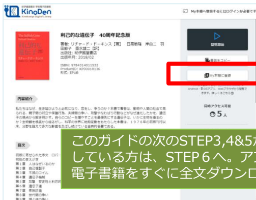
電子書籍詳細画面例（試し読みが表示される電子書籍はMy本棚に登録はできません）

このガイドの次のSTEP3,4&5が既に完了している方は、STEP 6へ。アプリから電子書籍をすぐに全文ダウンロードできます。