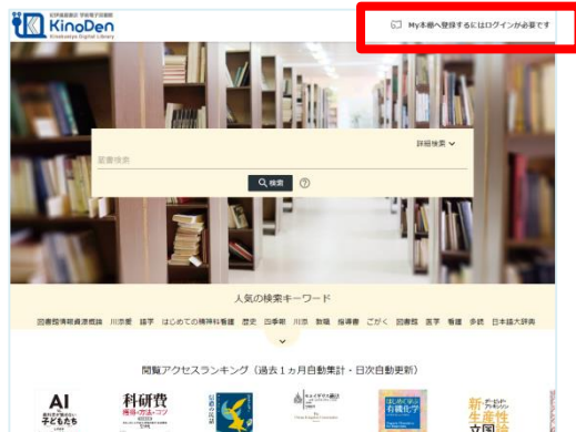
トップ画面からもログインできます。

(注意) 定期的にブラウザからKinoDen電子図書館サイトへのアクセスが必要です。 ※KinoDen 電子図書館サイトに長期間アクセスしていない場合は、アプリから電子書籍を開くときに(Step6参照)、KinoDen 電子図書館サイトへのアクセスとbREADER Cloudアカウントへのログインが必要となります。