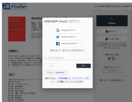
bREADER Cloudアカウント作成・ログイン画面例 Google, Twitter, Facebookアカウントも利用できます。